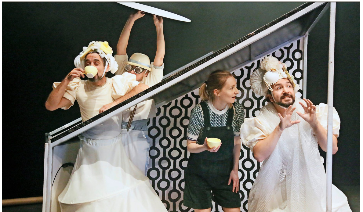
Von einem anderen Planeten oder der Wirklichkeit entsprungen? Coraline mit den schrulligen Nachbarinnen Ms. Spink und Ms. Spunk in Otherworld.

Musik Die Gitarren von Kaiser Chiefs, die nach langer Abstinenz wieder erklingende Stimme von Dido und der Rap-Pop-Mix von Cro im Unplugged-Gewand: Das Line-up des 13. Zermatt-Unplugged-Festivals, das vom 14. bis 18. April 2020 stattfindet, bietet einiges an Abwechslung. Zu den weiteren Highlights zählen die Veranstalter den Auftritt von James Morrison und vom Ronnie Scott's Jazz Club mit den Ronnie Scott's All Stars und Stargast Curtis Stigers. Der Ticketverkauf für den ersten Teil des Festivalprogramms startet am